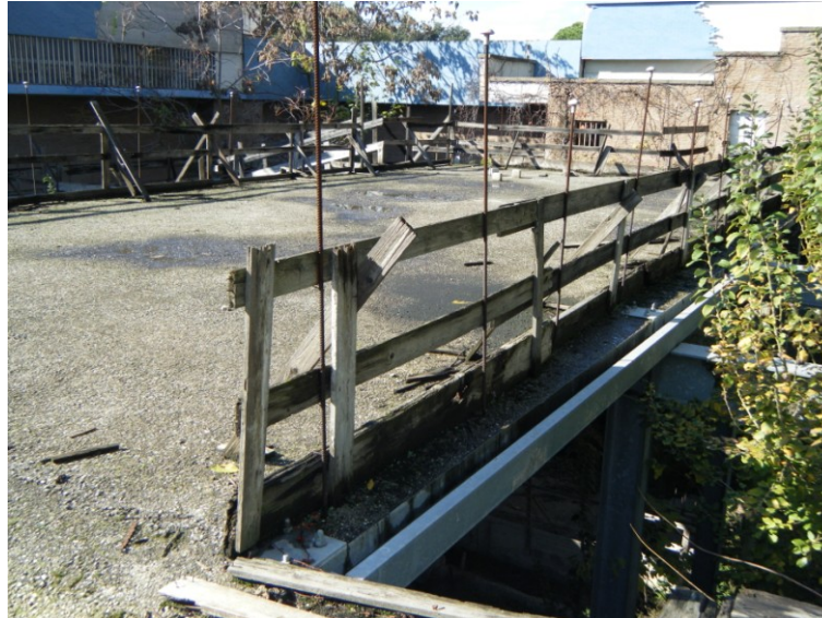
Vista dell'impalcato esistente – Edificio "Manica Breve"