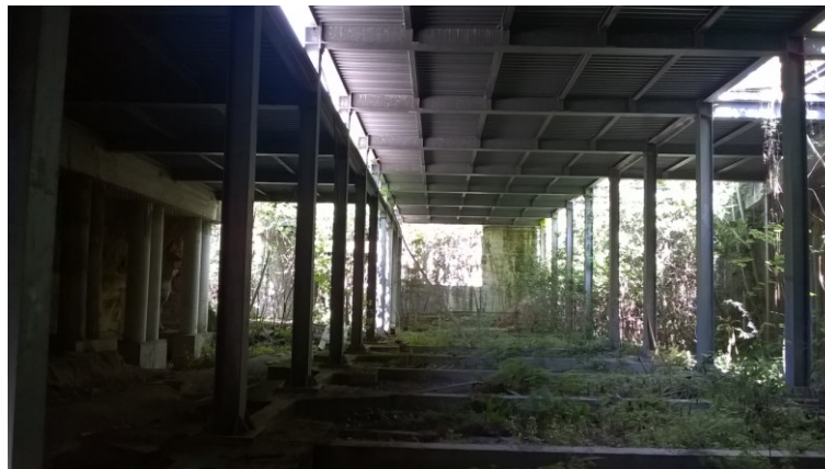
Vista delle strutture in elevazione ed in fondazione da demolire Edificio "Manica Breve"