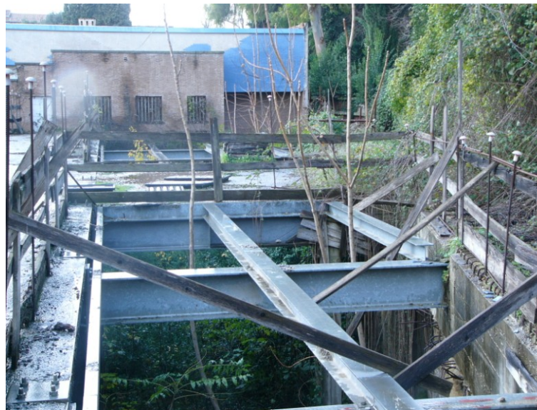
Vista dell'impalcato esistente – Edificio "Manica Breve"