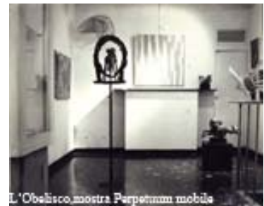
L'Obelisco, mostra Perpetuum mobile

A.B., Perpetuum mobile , Il Messaggero, Roma 29 giugno 1965